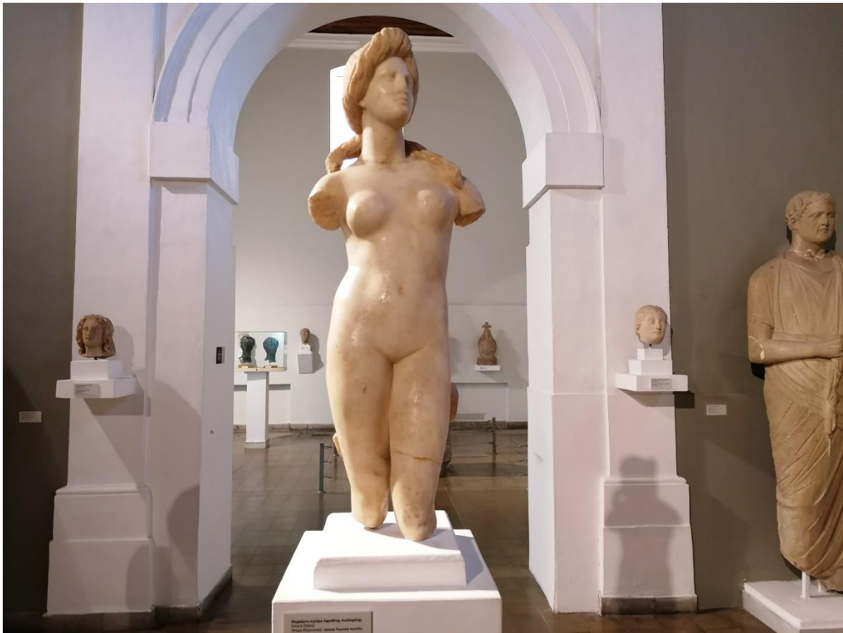
Aphrodite im Zypriotischen Museum

Exportunternehmen für Obst und Gemüse. Nikosia - die geteilte Stadt. Goethe Institut. Besuch im türkischen Teil der Insel. Kaffeepause in einer Karawanserei.